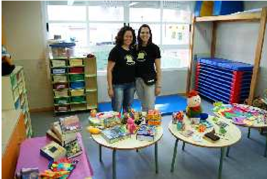
Mercadillo solidario en el Colegio Peñalvento