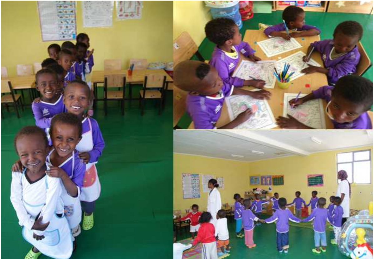
□ Diciembre de 2012. Dispositivo sanitario para la valoración médica de los niños del colegio de Bacho Walmara. Voluntariado Abay.